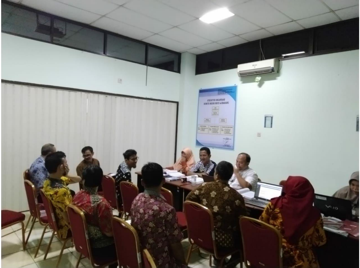
FOTO RAPAT EVALUASI PENGADUAN SEMESTER I